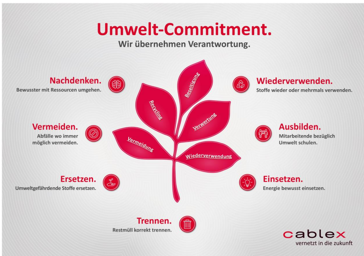
Abbildung 1: Umwelt-Commitment.

In diesem Zusammenhang ist auch die Sensibilisierung unserer Mitarbeitenden ein wichtiger Faktor. Wir haben die wichtigsten Aspekte unseres Umweltengagements für alle Mitarbeitenden zusammengefasst. Unsere Mitarbeitenden werden anhand eines eLearnings in Bezug auf unsere Vorgaben geschult. Dabei werden ihnen die konkreten Anwendungsfälle innerhalb der Firma und ihres Tätigkeitsbereiches aufgezeigt.