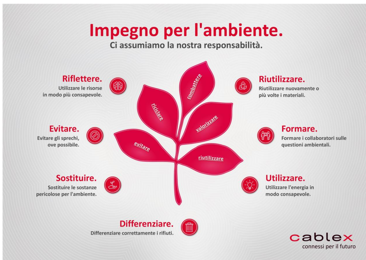
Figura 1: Impegno ambientale.

In questo contesto, anche la sensibilizzazione dei nostri collaboratori è un fattore importante. Per tutti loro, abbiamo riassunto gli aspetti più importanti del nostro impegno ambientale. I nostri dipendenti ricevono una formazione sui nostri requisiti tramite e-learning. I corsi illustrano i casi di applicazione concreti all'interno dell'azienda e la relativa area di attività.